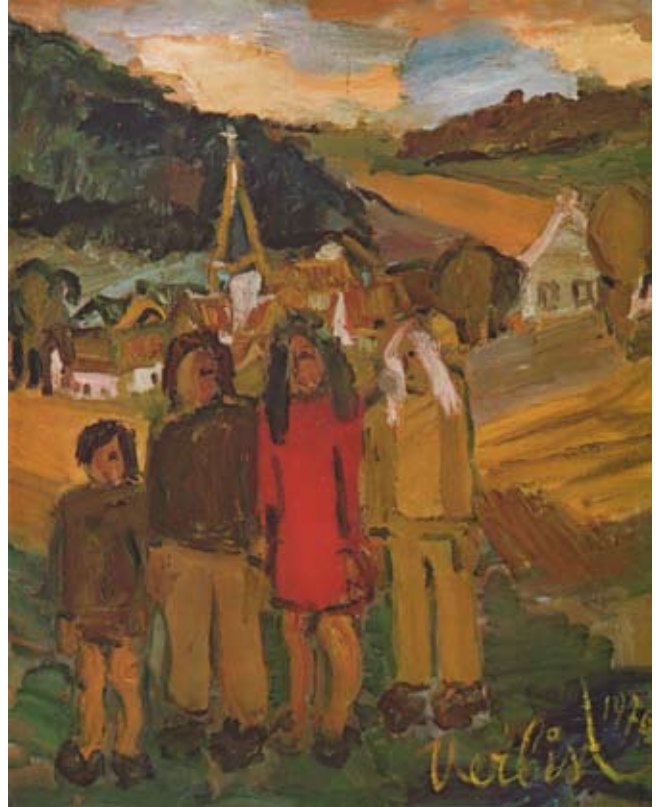
In de weide 1970, olie/doek 80 x 65 cm

eigen plan hun huis, “Klokke Belle”, te bouwen in Veltem-Beisem op een helling langs de steenweg. Een huis dat, net als Verbist zelf, uniek is van architectuur en materiaalkeuze. Een huis dat hijzelf “mijn beste werk” noemde (zie aparte bijdrage: In Veltem-Beisem staat een huis...).