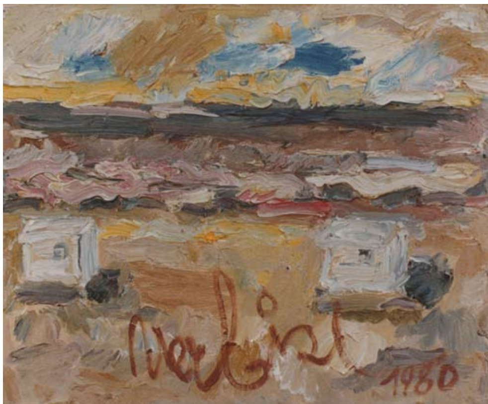
Strandkabinen, 1980 olie/doek 60 x 70 cm

zaam gebruik van de verf en het vermijden van alle vulgariteit van kleur, en men heeft een denkbeeld van zijn voorname aquarelkunst, die gedragen wordt door een complexe innerlijkheid.