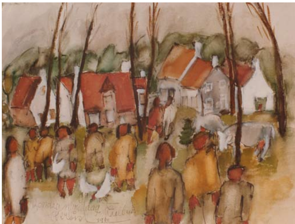
Zondagnamiddag te Vaalbeek, aquarel, 1980

figuren veelal geabstraheerd, elementen geordend en uitgezuiverd tot gefilterde composities, die nooit een kopie van de natuur impliceren. Behalve de poëtische bladvulling treffen het raffinement van kleur en de bekoorlijkheid van atmosfeer.