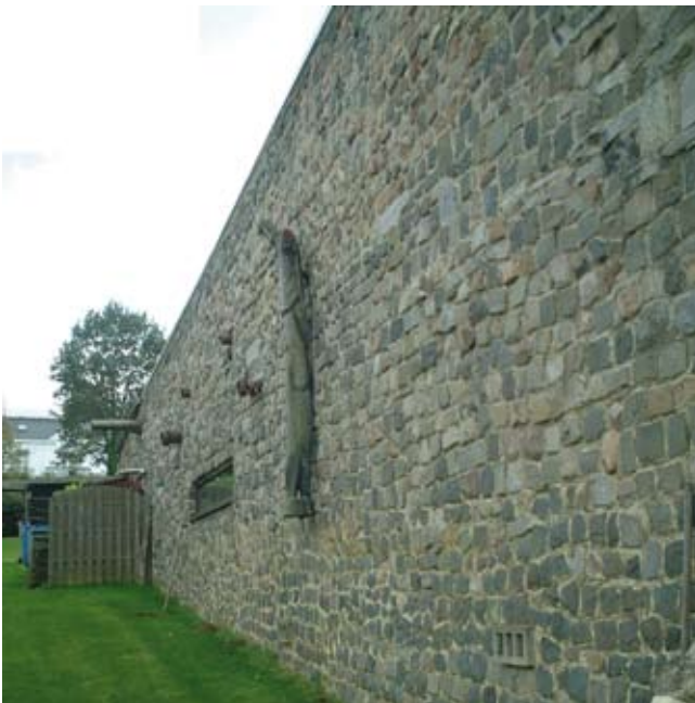
Oostgevel atelier opgericht uit allerlei soorten stenen.