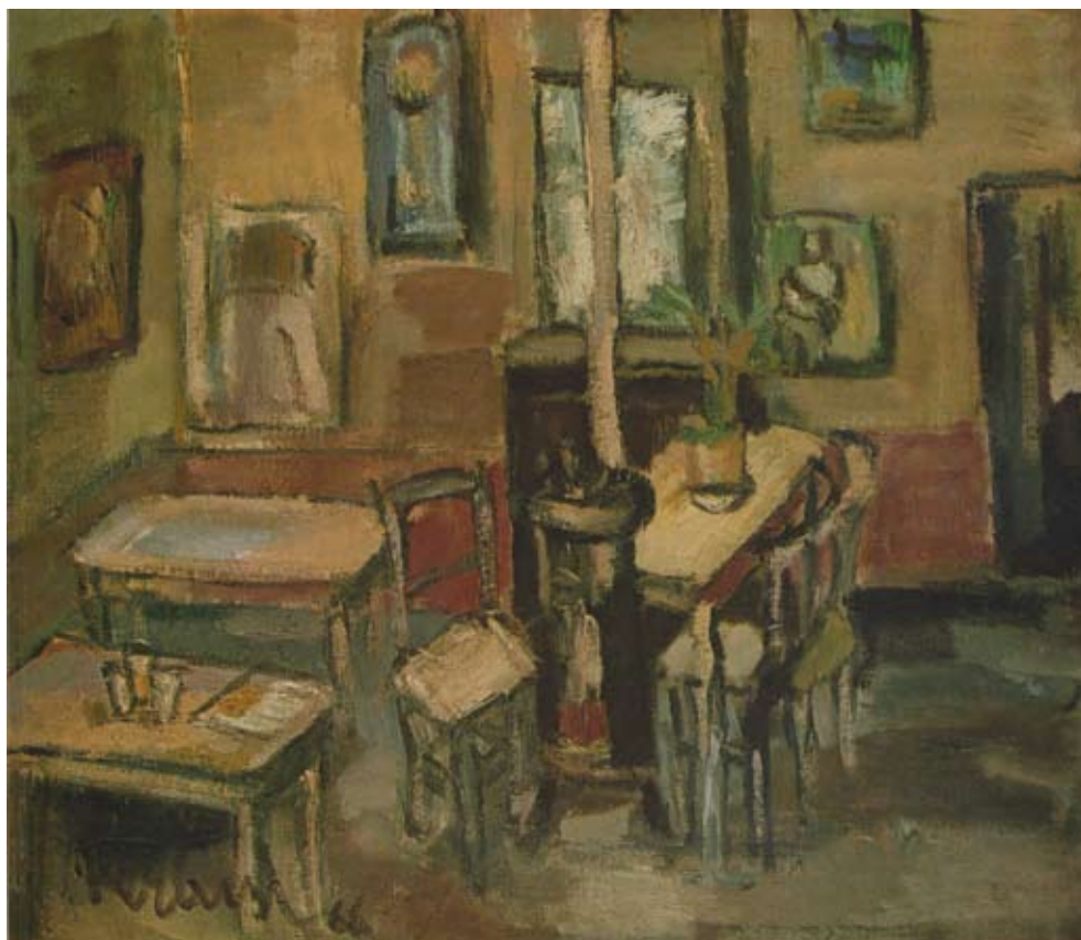
Herberg te Sint Anna Pede, 1966, olie/doek 60 x 70 cm