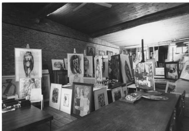
Zicht van het atelier naar de toegangstrap met patio.

uitgemeten zijn als zijn vermaarde gastvrijheid. Het vroegere terras aan de westzijde opgetrokken in Diegemse witte zandsteen, is door de huidige eigenaars gewijzigd in een afgesloten zonnige zithoek die wonderwel aansluit bij het geheel, helemaal zoals Verbist het zag. Er zijn in dit huis en er-buiten nog meer verrukkelijke plekjes, teveel om ze allemaal te beschrijven. Letterlijk elke vierkante meter is het bekijken waard. Langs een vriendelijk binnenkoertje komen we door een ouderwets aandoende maar bij nader toezicht toch zo praktische keuken, in de eigenlijke leefkamer. Ook hier is alles, van de wel erg geslaagde open haard tot het kleinste detail, van eigen vinding en uitvoering.