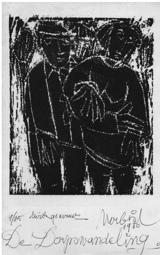
De dorpswandeling, kurkgravure, 1980