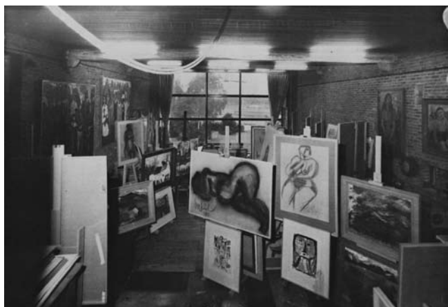
Verbist's indrukwekkende atelier met het enorme raam.