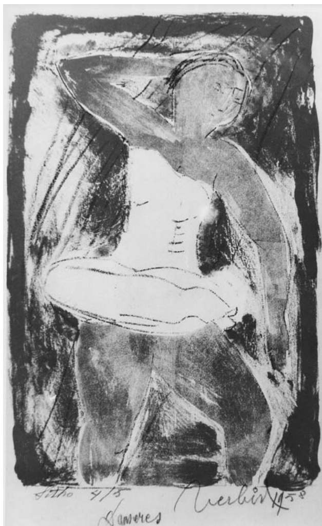
Danseres, steendruk, 1958