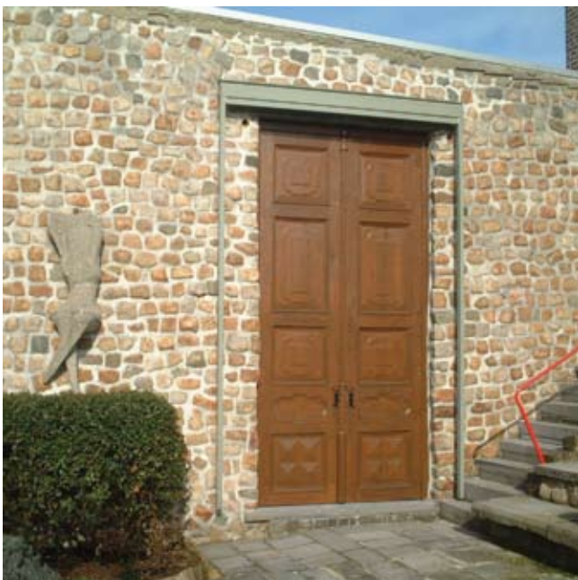
De indrukwekkende ingangspoort van het atelier.